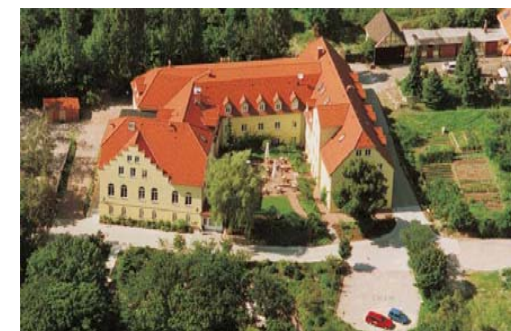
Hotel Dorotheenhof, Weimar